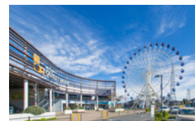
เดินประมาณ 10 นาทีจาก Mitsui Outlet Park Sendai Port