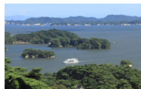
ประมาณ 30 นาทีจากมัดสึชิมะ